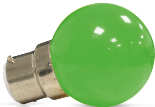
Ampoules incassables (globe en polycarbonate)