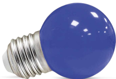
Globe en polycarbonate