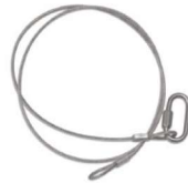
Fillin de sécurité x2