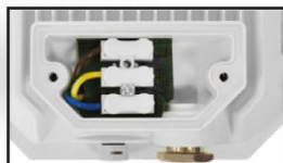
Connecteur interne + presse-étoupe + valve anti-condensation